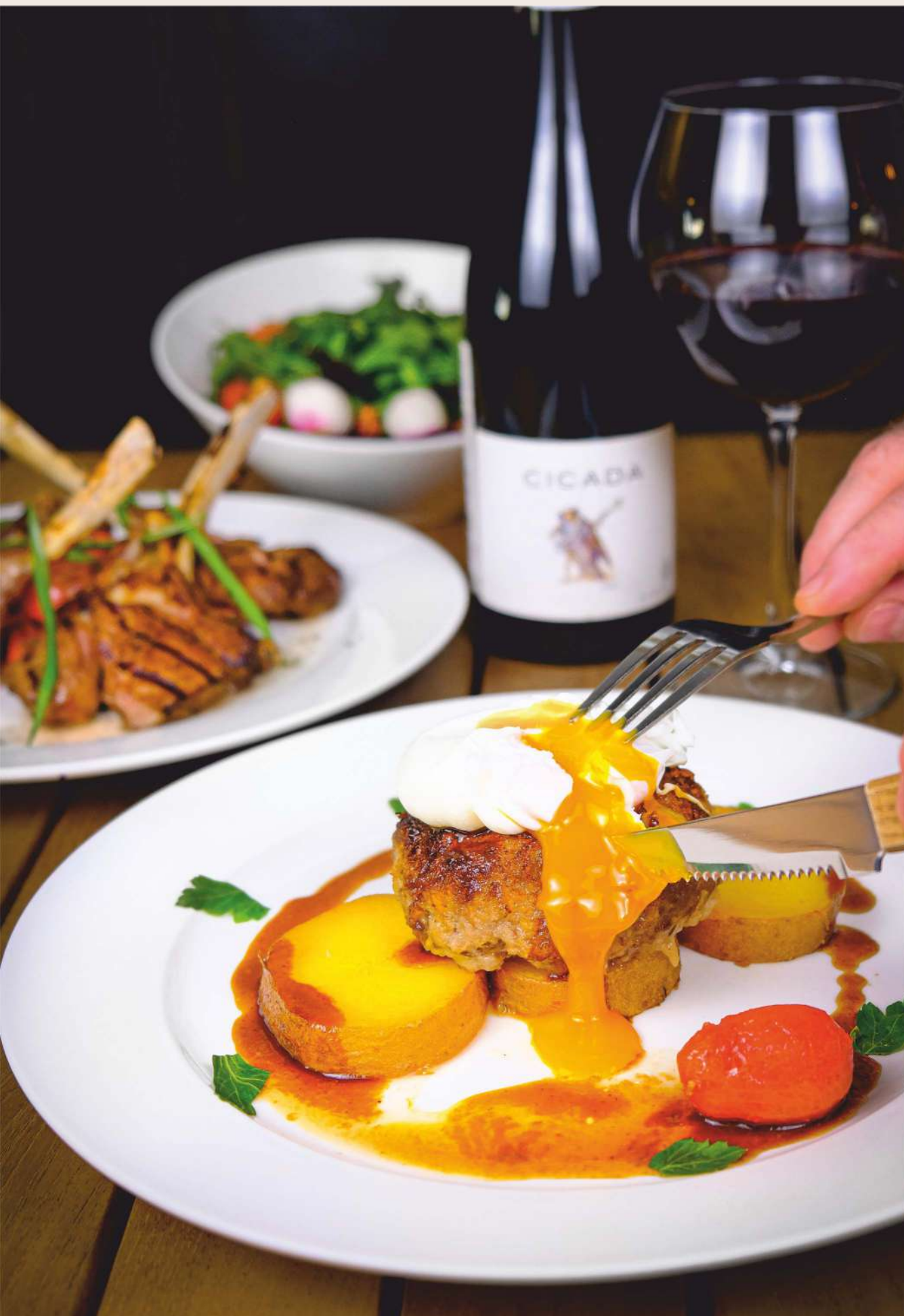
Бифштекс из говядины с яйцом пашот