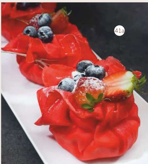
41a Красные блины с ягодами, кремом маскарпоне 3 800

41 Панкейки в персиковом соусе со сливочным мороженым 3 600