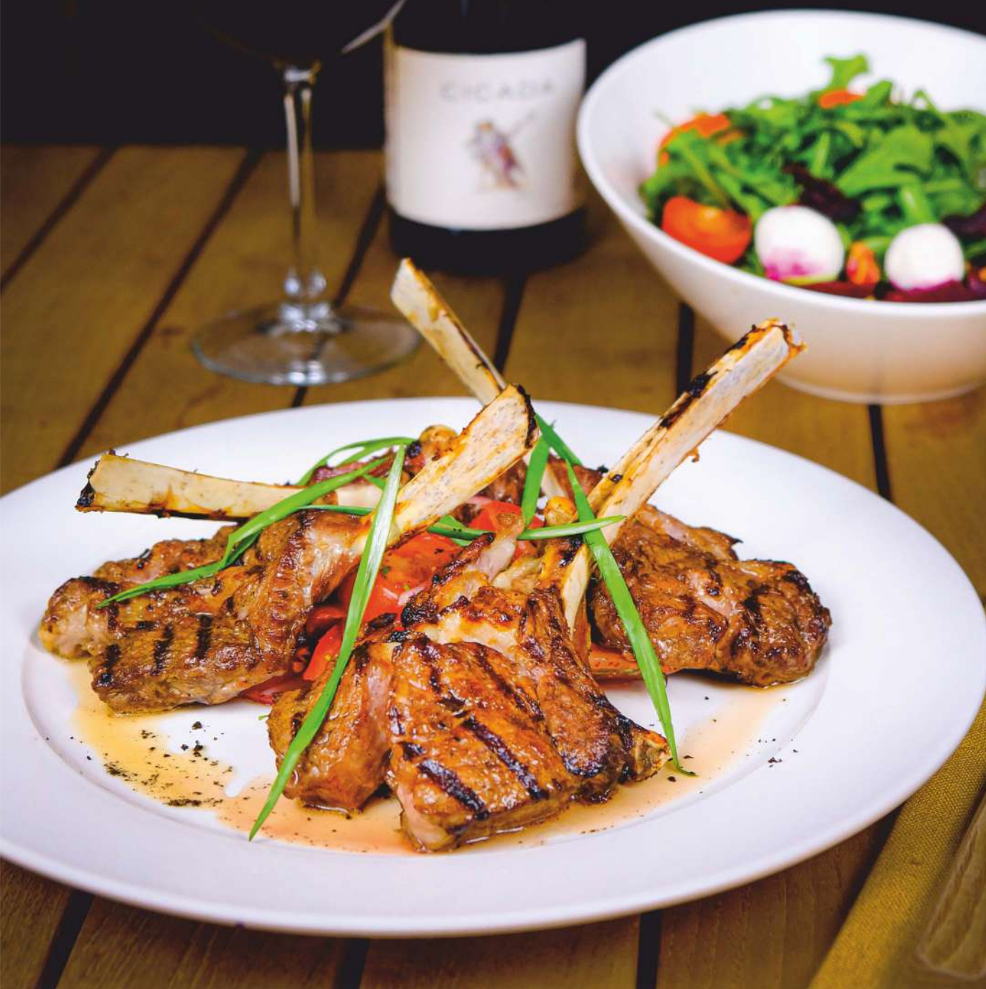
Карре ягнёнка Карре ягнёнка с нежным салатом Ачи-чук